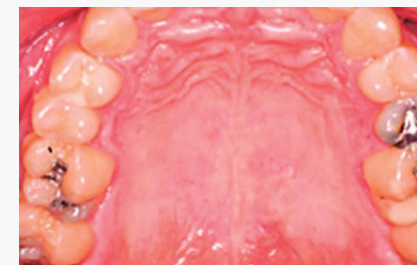
Imagen del paladar a simple vista.