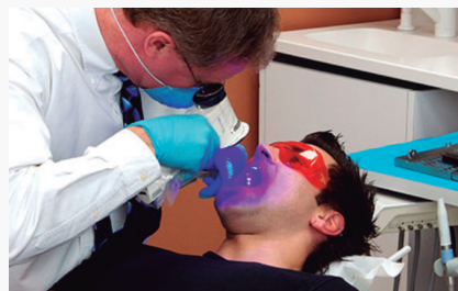
Examen con VELscope® Vx en consulta.

VELscope® Vx está avalado por más de 25 millones de exámenes realizados por 12.000 profesionales de la odontología en 23 países y está respaldado por más estudios clínicos que cualquier otro dispositivo de estas características.